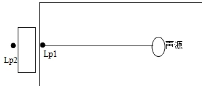
图 4-1 室内声源等效为室外声源图例